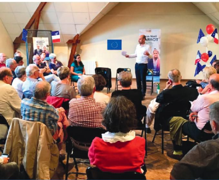
Réunion publique à Toussus-le-Noble

Une réunion publique ouverte à toutes et tous chaque mois