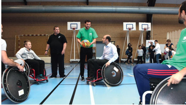
Match d'handibasket au centre sportif Les Pyramides à Voisins-le-Bretonneux