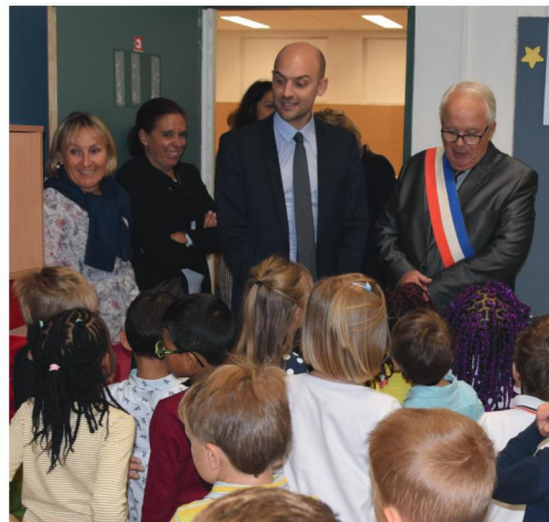
Rentrée des classes à Buc