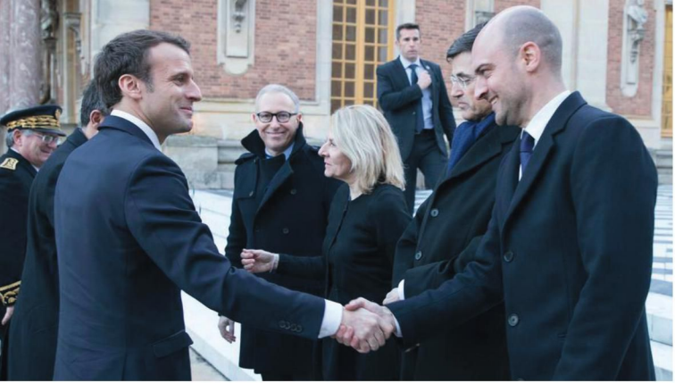
Avec le Président de la République, au sommet "Choose France" au Château de Versailles