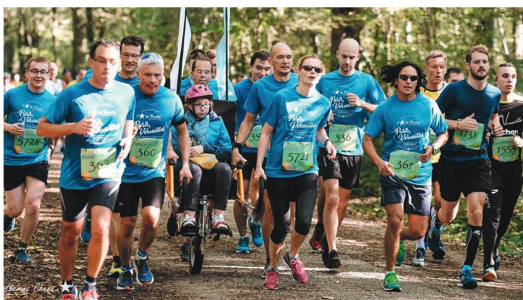
Course Paris-Versailles au profit de l'association « l'Étoile de Martin »