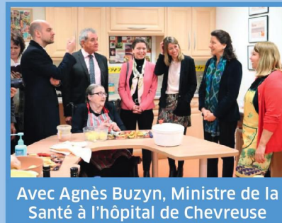
Voeux à l'hôpital de Chevreuse