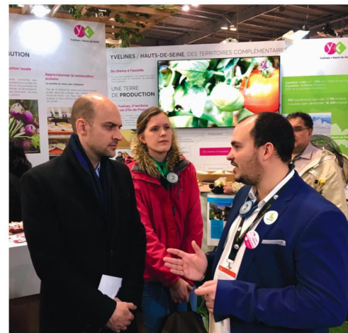
Stand des Jeunes Agriculteurs au Salon de l'agriculture