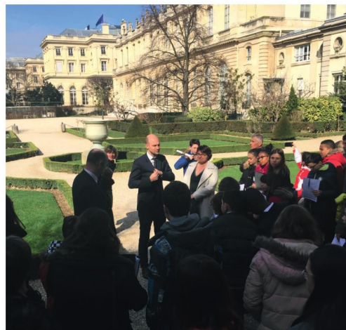
Visite de l'Assemblée par le Conseil Municipal Jeunes de Voisins-le-Bretonneux