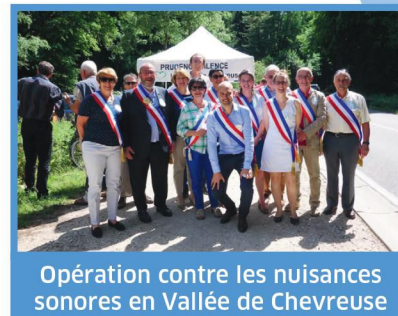
Opération contre les nuisances sonores en Vallée de Chevreuse