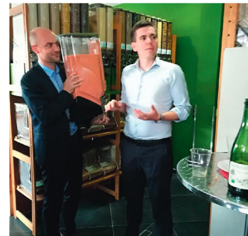
Inauguration d'un commerce bio, à Viroflay