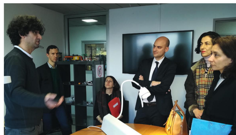
Visite de l'IUT de Vélizy, avec Delphine Gény-Stéphann, Secrétaire d'Etat auprès du Ministre de l'Economie et des Finances