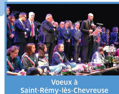
Voeux à Saint-Rémy-lès-Chevreuse