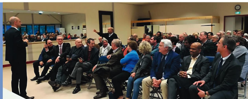
Réunion publique à Jouy-en-Josas