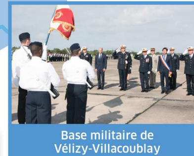
Base militaire de Vélizy-Villacoublay