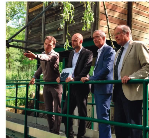
Visite des aménagements hydrauliques de la vallée de la Bièvre