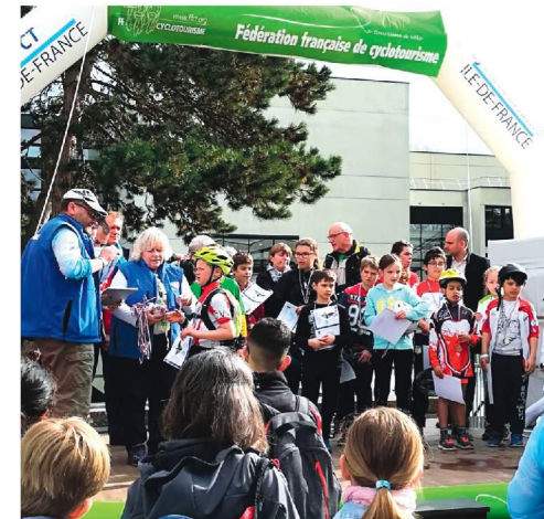
Cérémonie de lancement de la Jean Racine à Saint-Rémy-lès-Chevreuse