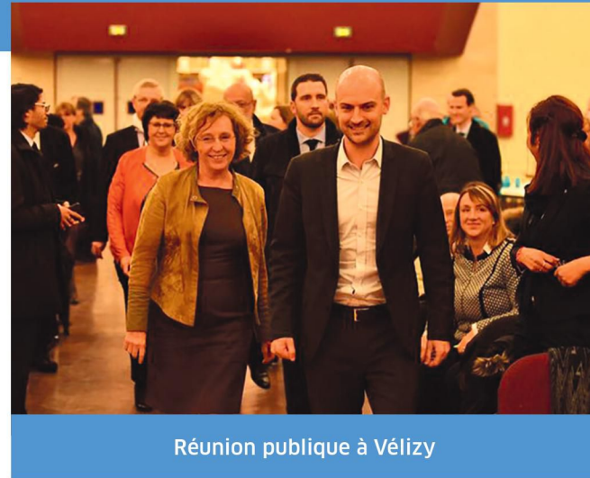
Réunion publique à Vélizy

les 2 piliers de ma démarche pour porter au mieux votre voix à l'Assemblée