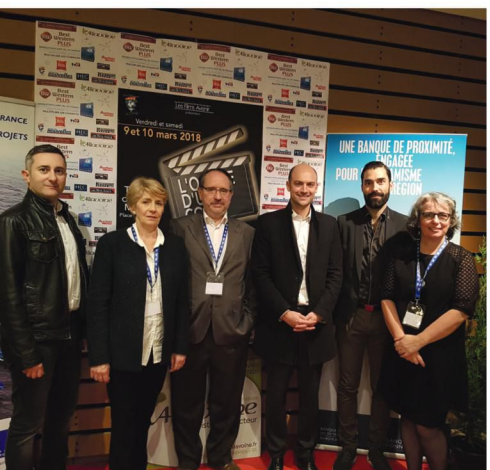
Festival international du film court de Jouy-en-Josas