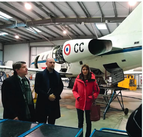
Aérodrome de Toussus-le-Noble