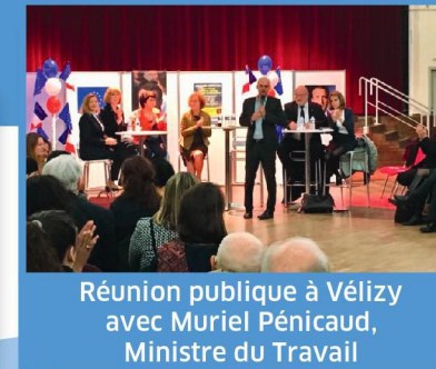
Réunion publique à Vélizy avec Muriel Pénicaud, Ministre du Travail