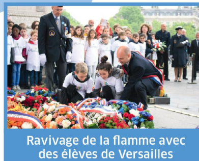
Ravivage de la flamme avec des élèves de Versailles