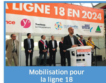
Mobilisation pour la ligne 18