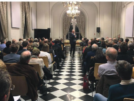
Réunion publique à Buc