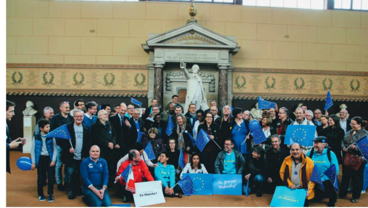
Lancement de la Grande Marche pour l'Europe à la salle du Jeu de Paume