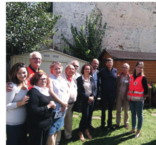
Vente annuelle de la Croix-Rouge, à Versailles