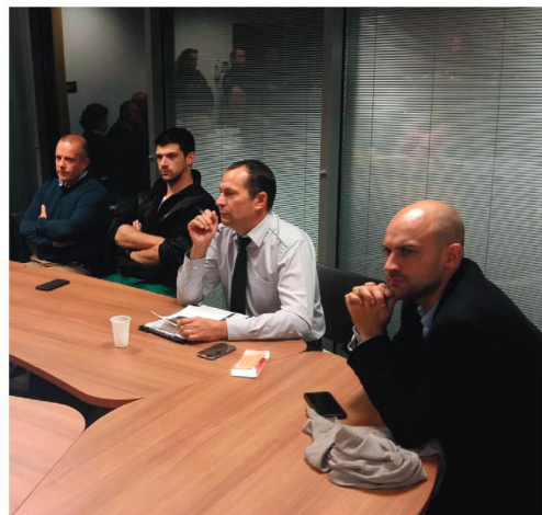
Exercice nocturne de sécurité incendie avec la RATP, à Velizy