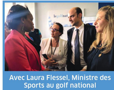
Avec Laura Flessel, Ministre des Sports au golf national