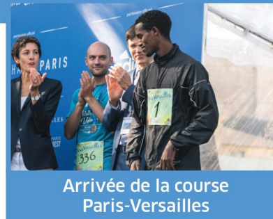
Arrivée de la course Paris-Versailles