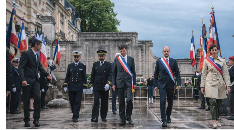
73 ème anniversaire de la Libération de Versailles