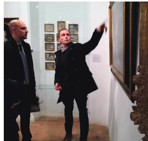
Musée de l'Abbaye de Port Royal à Magny-les-Hameaux