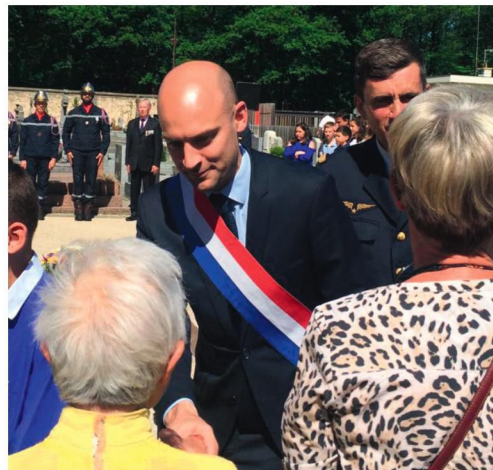
Commémoration du 8 mai à Vélizy