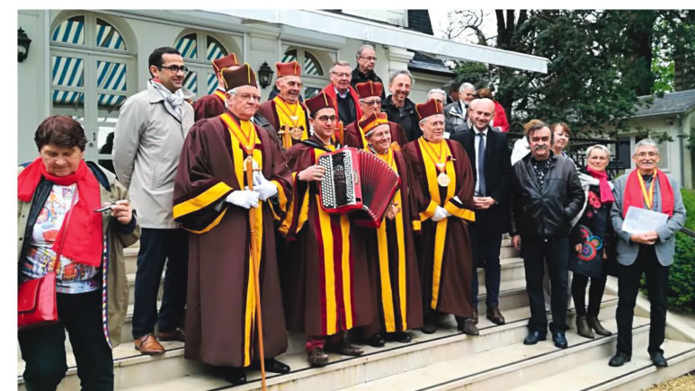
Musée Raymond Devos à Saint-Rémy-lès-Chevreuse