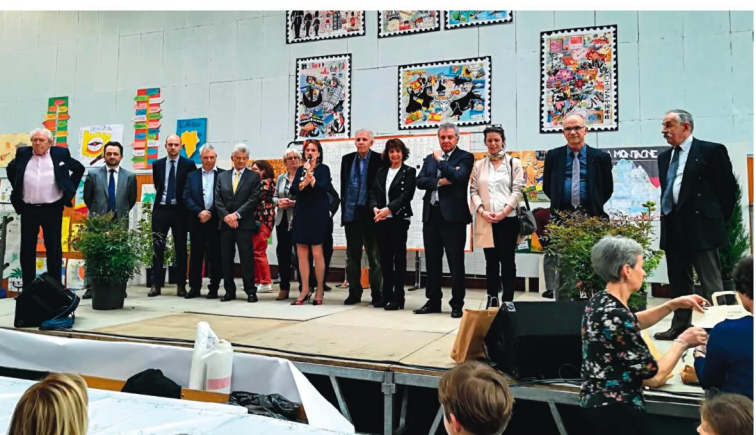
Salon du livre de jeunesse de la Vallée de Chevreuse